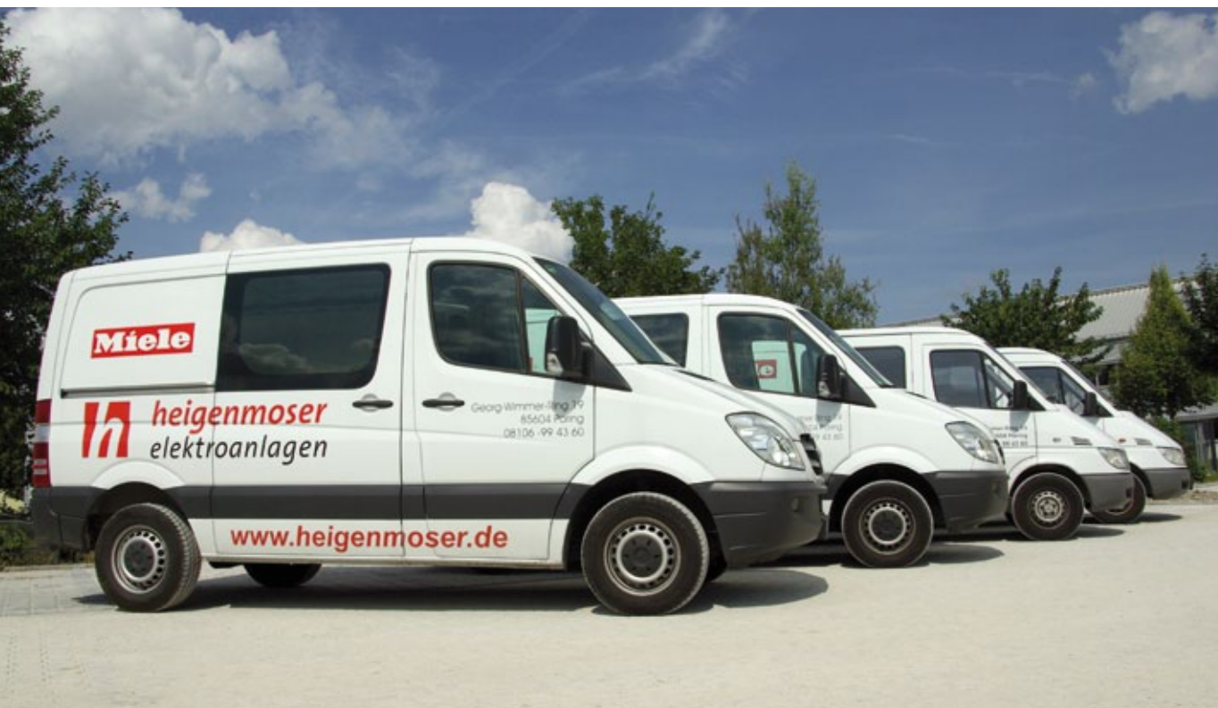
Auszug aus unserem Fuhrpark